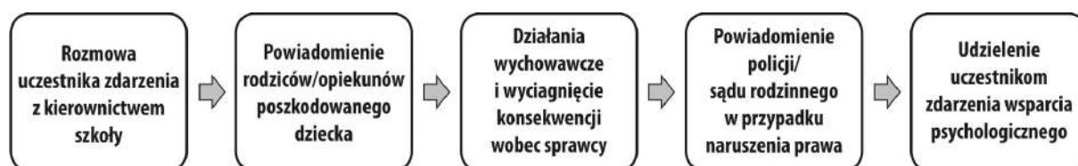
Rys 1. Standard procedury reakcji na zagrożenie bezpieczeństwa cyfrowego